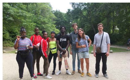
Photo: Dimanche 23 juin - Dimanche au Thabor

Jeunes, réunissant des 14-23 ans de tous les coins de Rennes. Par la mise à disposition de la salle de danse et de la salle polyvalente, c'est plus de cinq groupes de danseur.euses qui s'entraînent régulièrement. L'idée est de continuer, pour cette nouvelle saison, d'accompagner et de proposer des ateliers et activités pour les jeunes autour de leurs pratiques culturelles, de les valoriser et les amener à s'ouvrir à de nouvelles pratiques.