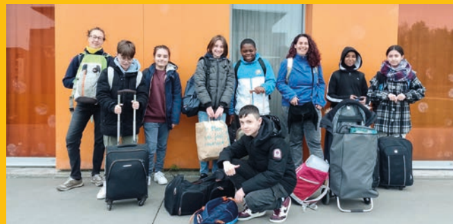
Le départ en séjour des jeunes de l'accompagnement à la scolarité pour Cancale en avril 2023